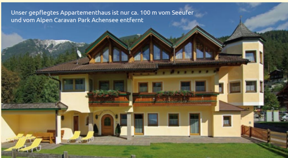
Unser gepflegtes Appartementhaus ist nur ca. 100 m vom Seeufer und vom Alpen Caravan Park Achensee entfernt